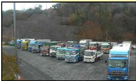
大型車駐車状況(平日)