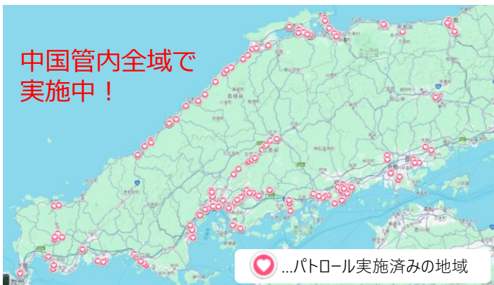
...パトロール実施済みの地域

トラックドライバーの労働環境改善、適正運賃の収受の必要性について荷主等事業者に教示