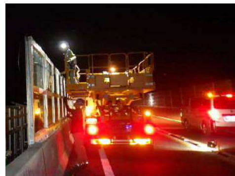
《落下物防護柵設置作業イメージ》