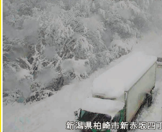
新潟県柏崎市新赤坂四丁目 下り